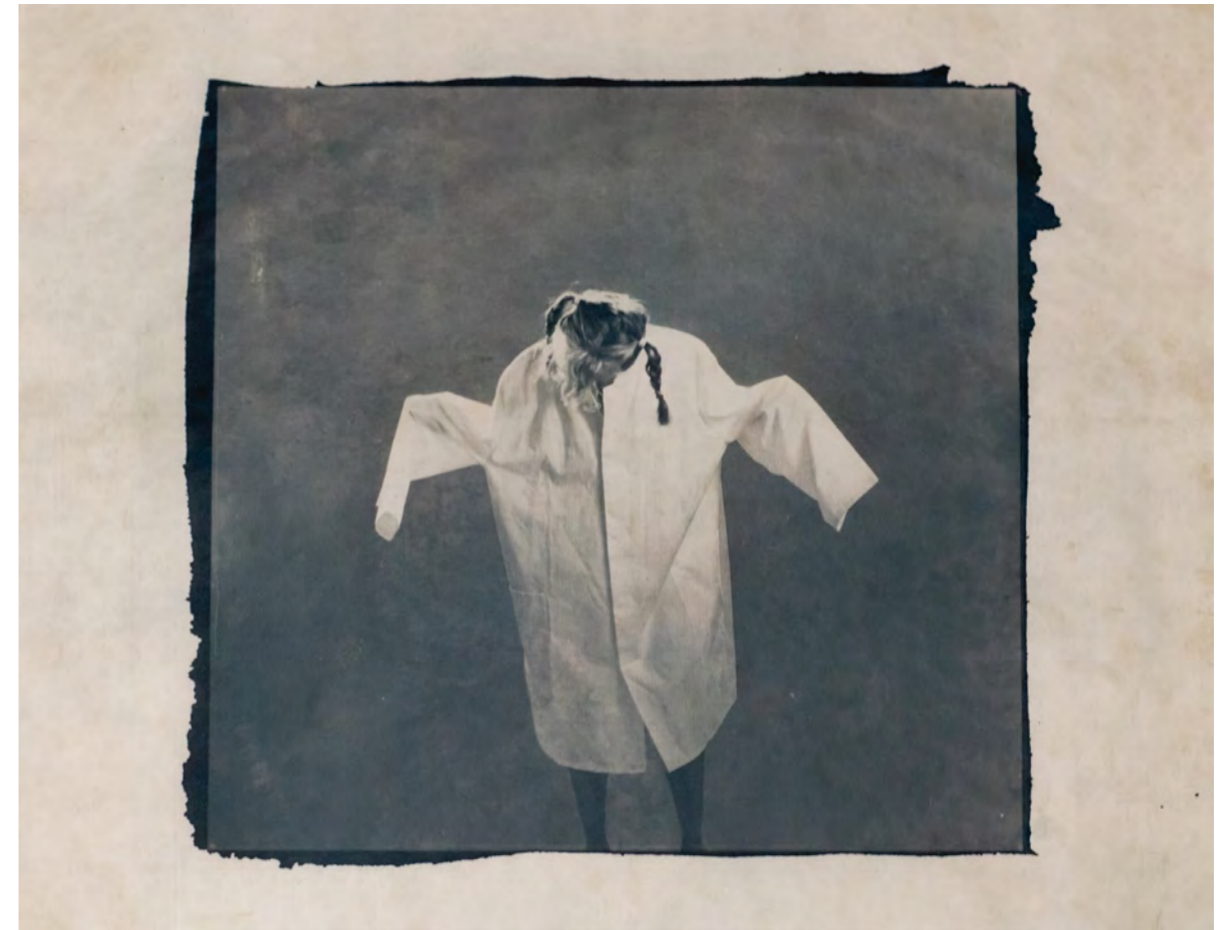
Techniek: getinte cyanotypes, gedrukt op rijstpapier; analog digitaal.

Mijn collega's en ik worden gebruikt als verwisselbare instrumenten. Gevoelens van angst, machteloosheid, overwerkt zijn, mislukking, schuld en verdriet zijn taboe. Afgaande op het grote aantal professionals dat op dit moment de zorg wil verlaten, lijkt de situatie in 2023 nog slechter te zijn dan in 1989, toen ik door de eerder genoemde draaideur liep.